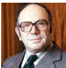
L. Kantorovich Nobel, 1975

De manera independiente, Tjalling Charles Koopmans también desarrolló avances en los problemas del transporte.