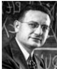
P. A. Samuelson Nobel, 1970