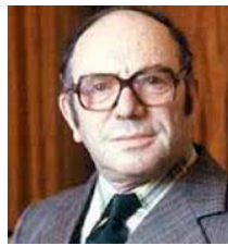
Kantorovich Nobel, 1975