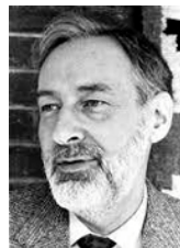
Koopmans Nobel, 1975