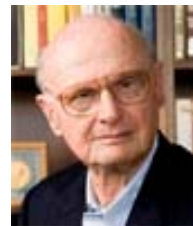
Markowitz Nobel, 1990