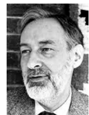
L. Koopmans Nobel, 1975

Para su solución, emplearon métodos geométricos que están relacionados con la teoría de convexidad de Minkowski.