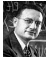
Samuelson Nobel, 1970