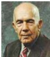
Hitchcock Nobel, 1975