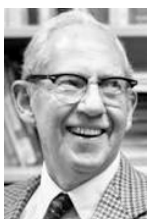
G. Stigler Nobel, 1982

En 1945, George Joseph Stigler planteó el problema de la dieta, a raíz de la preocupación del ejército americano por asegurar unos requerimientos nutricionales básicos para sus tropas al menor coste posible. El problema fue resuelto manualmente mediante un método heurístico con el cual se examinaron 510 diferentes posibilidades de combinación de alimentos, y cuya solución difería tan sólo unos céntimos de la solución aportada años más tarde por el método Simplex.