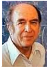
L. Hurwicz Nobel, 2007