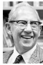
Stigler Nobel, 1982