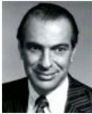
K. Arrow Nobel, 1972