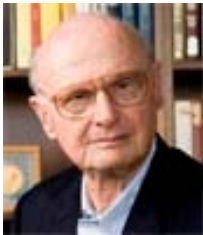
H. M. Markowitz Nobel, 1990

Para resolverlo se utilizó un ordenador Strena en el mes de junio de 1958, y después de 10 días de cálculos produjo una solución que aportó una reducción del 11% de los gastos respecto a los costes originales previstos.